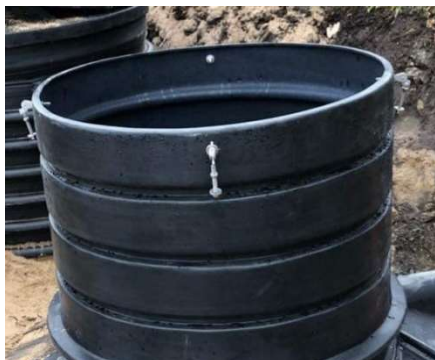
Figur 4: Fäst bultarna i överkant av förhöjningen.

Skruva fast bultarna på ovansidan av förhöjningen.