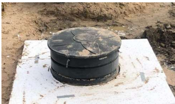
Figur 6: Avlasta med frigolit.

OBS! Viktigt att avlasta kupolen med frigolit för att minska marktrycket på tanken! Fyll upp med frigolit till åtminstone 20 cm under markytan, därefter kan man fylla på med max 20cm jord.