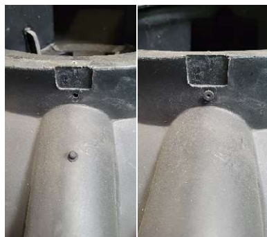
Figur 3: Plugga igen de hål som blir på ProACT/PumpACT när man tagit bort bultarna.

När du kapat förhöjningen till önskad höjd, ta loss bultarna från ProACT/PumpACT. Plugga igen de hål i ProACT/PumpACT som uppstått med medföljande plugg.