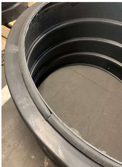
Figur 1: Fäst gummilisten mot kanten.

Börja med att limma fast den medföljande gummilisten mot kanten som Figur 1 visar. OBS! Det är alltså den sida som har en liten kant som gummilisten ska fästas mot. Denna sida kommer sedan att vara vänd nedåt mot tanken. Den andra sidan (se Figur 2) har en rundad kant, locket kommer att ligga mot denna kant.