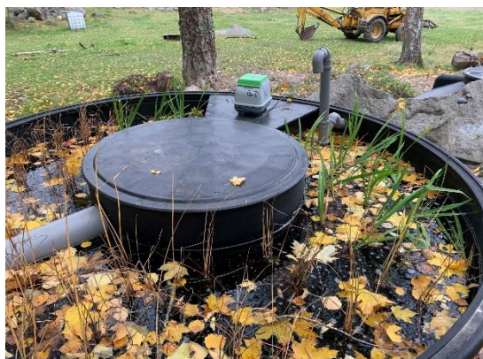
Nyplanterad anläggning -ta bort löven! Nyklippt anläggning